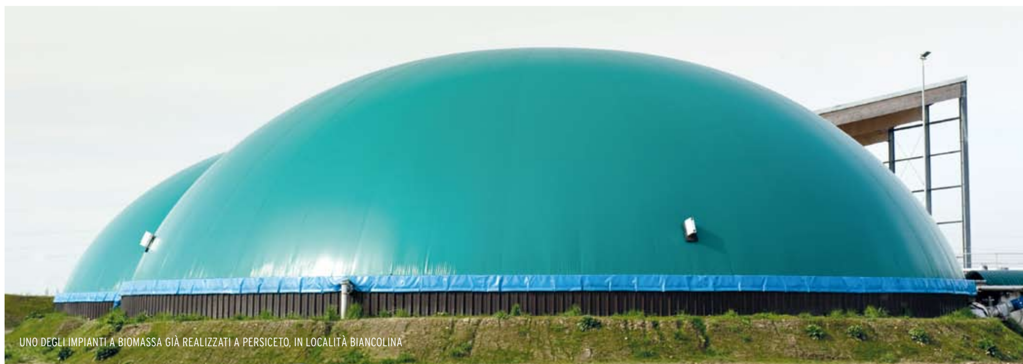
UNO DEGLI IMPIANTI A BIOMASSA GIÀ REALIZZATI A PERSICETO, IN LOCALITÀ BIANCOLINA

“Personalmente ritengo che il compromesso sia raggiungibile con il concreto e positivo impegno di tutte le parti coinvolte, come è stato nel nostro caso. Ritengo che il cosiddetto atteggiamento Nimby sia dettato dalla diffidenza verso il fatto che i nuovi impianti o infrastrutture, in particolare mi riferisco a quelle inerenti la biomassa, possano divenire un puro investimento per i privati costruttori, senza la minima attenzione per la produzione di energia rinnovabile attraverso un sistema pulito, ben integrato nell'ambiente e senza implicazioni negative per la qualità di vita di chi ci sta attorno. Penso poi che il compromesso sarà ancora più facilmente raggiungibile con una legislazione più precisa e più attenta a tali esigenze, mediante l'imposizione di prescrizioni nella progettazione e costruzione degli impianti e controlli concreti durante il funzionamento; aggiungo infine che secondo me è importante e fondamentale che tali controlli siano demandati direttamente agli enti pubblici territoriali, ossia principalmente ai Comuni e alle Province che ospitano gli impianti.”