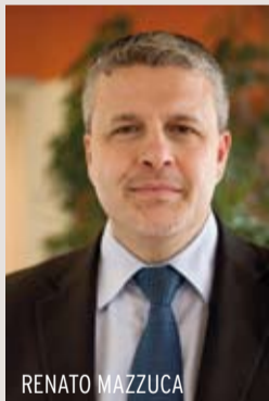
> Renato Mazzuca, sindaco di Persiceto

L'unione fa la forza non è solo un modo di dire ma un'esperienza che abbiamo fatto tutti, almeno una volta nella vita. Essere in molti ed avere un obiettivo comune, chiaro e definito, è la base ideale che sostiene l'intero mondo dell'associazionismo e del volontariato; due realtà che ben conosciamo per la loro radicata presenza sul territorio, per le molteplici attività sociali che svolgono e per l'elevata efficacia dei servizi che rendono alla comunità. Penso alle società sportive e culturali, alle associazioni di promozione sociale e territoriale e alle tante altre che fanno dell'unione di intenti e risorse il proprio punto di forza.