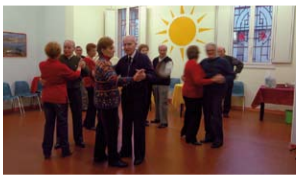
Un momento di svago al Centro sociale "La Stalla"

Sono in corso di assegnazione i lavori per realizzare la nuova sede del Centro sociale per anziani "La stalla", che attualmente si trova in via Guardia Nazionale.