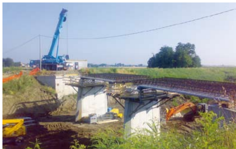
I lavori di rifacimento del ponte Gerber alle Budrie

Le opere edili e quelle relative all'impianto di illuminazione pubblica termineranno nei prossimi due mesi, mentre la piantumazione