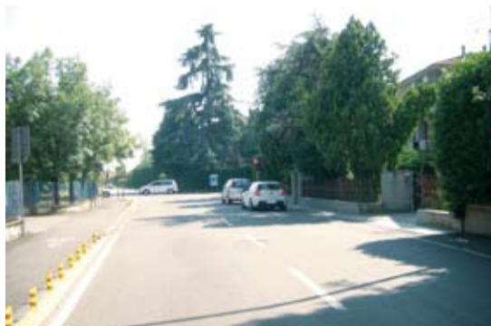
Incrocio tra via Cappuccini e via Costa

Sempre per limitare la velocità sulle strade e favorire la sicurezza, in via Andrea Costa e in via XXV Aprile saranno realizzati alcuni passaggi pedonali rialzati.