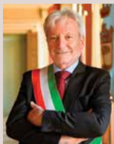
> Lorenzo Pellegatti Sindaco di Persiceto

Carissime e carissimi, mi accingo a scrivere questo articolo a pochi mesi dall'insediamento della nuova amministrazione comunale. Alle recenti consultazioni elettorali la maggioranza dei cittadini persicetani (potete vedere tutti i risultati in dettaglio a pag.2) ha voluto riconfermarci alla guida del nostro comune. Questo risultato mi ha reso molto felice, soprattutto perché l'ho interpretato come una volontà dei persicetani a proseguire sulla linea intrapresa negli ultimi cinque anni: portare avanti il cambiamento, proseguire nella ridefinizione di una Persiceto al passo coi tempi ma attenta alle esigenze dei suoi abitanti.